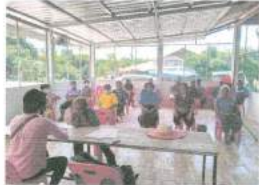
๑๘. โครงการจัดการสิ่งแวดล้อมในชุมชน