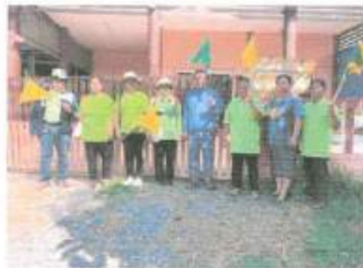
๑๙. โครงการขุดลอกว่าาสางสาธารณะบ้านหนองแวง หมู่ที่ ๑๑