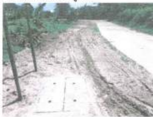
๒๙.โครงการก่อสร้างถนนลูกรังเพื่อการเกษตร บ้านบะทองใหม่ หมู่ ๑๒ (จากที่นางางอ้าย พระอมาตย์-ที่นายบันเทิง ไชยบุตร)