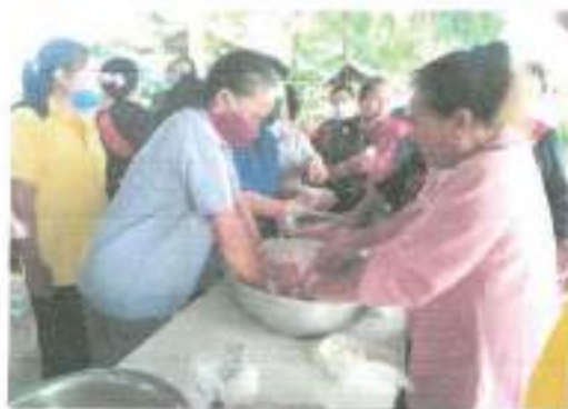
๑๔.โครงการตัดไม้ปลูกโรค คนปลอดภัยจากโรคพิษสุนัขบ้า