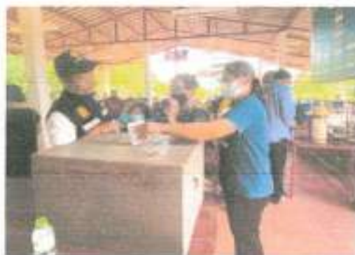
๓๕.โครงการฝึกอบรมชุดอาสาภัยพิบัติประจำเทศบาลตำบลพรหมานนคร