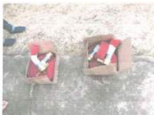
๓๔.โครงการป้องกันและแก้ไขปัญหายาเสพติด