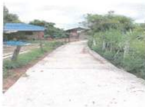
๒๕.โครงการก่อสร้างถนนลูกรังเพื่อการเกษตร บ้านวังปลาป้อม หมู่ที่ ๓ (จากสะพาน-หนองหัวควาย)