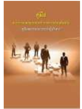
หนังสือ สมรรถนะประจำผู้บริหาร