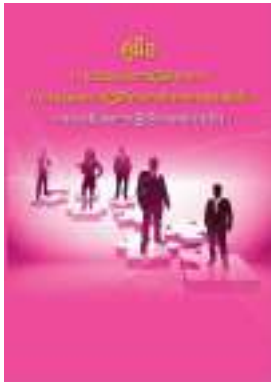
หนังสือ การประเมินผลการปฏิบัติงานพนักงานจ้าง