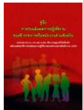
หนังสือ การประเมินผลการปฏิบัติงาน ของข้าราชการหรือพนักงานส่วนท้องถิ่น