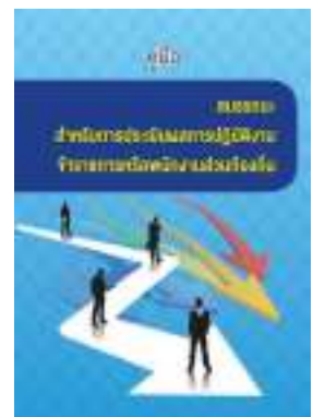
หนังสือ สมรรถนะสำหรับการประเมินผลการปฏิบัติงาน ข้าราชการหรือพนักงานส่วนท้องถิ่น