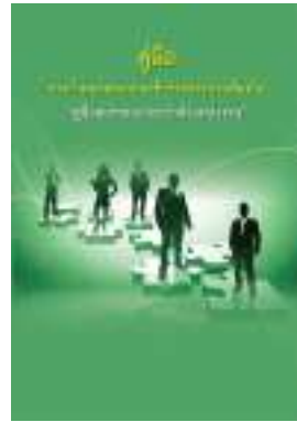
หนังสือ สมรรถนะประจำตำแหน่งงาน