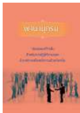
หนังสือ สมรรถนะที่จำเป็นสำหรับการปฏิบัติงานของ ข้าราชการหรือพนักงานส่วนท้องถิ่น