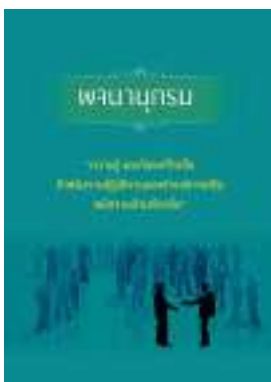
หนังสือ ความรู้ และทักษะที่จำเป็น สำหรับการปฏิบัติ งานของข้าราชการหรือพนักงานส่วนท้องถิ่น