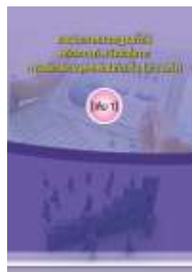
หนังสือ รวมประกาศมาตรฐานทั่วไป หลักเกณฑ์ หนังสือสั่งการ การบริหารงานบุคคลส่วนท้องถิ่น