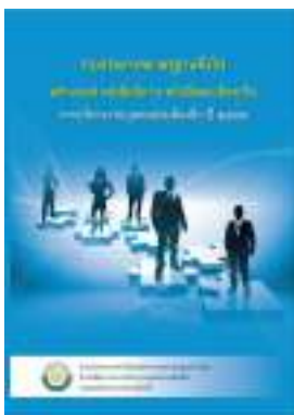
หนังสือ หลักเกณฑ์ หนังสือสั่งการ หนังสือตอบข้อหารือ การบริหารงานบุคคลส่วนท้องถิ่น ปี ๒๕๕๗