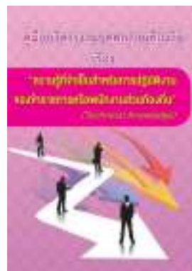
หนังสือ ความรู้ที่จำเป็นสำหรับการปฏิบัติงาน ของข้าราชการหรือพนักงานส่วนท้องถิ่น