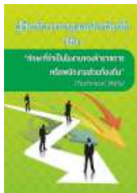
หนังสือ ทักษะที่จำเป็นในงานของข้าราชการ หรือพนักงานส่วนท้องถิ่น