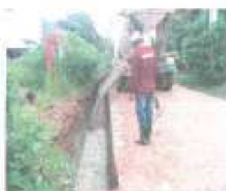
ระหว่างดำเนินการ