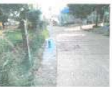
ดำเนินการแล้วเสร็จ

๒๐.โครงการก่อสร้างถนนคอนกรีตเสริมเหล็กบ้านนาหัวช้าง หมู่ ๔ สายบ้านนาสูงหิน แสนศรี - บ้านนางจุติมา ศรีประภา