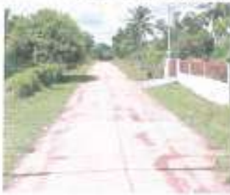
ก่อนดำเนินการ

๓๘.โครงการก่อสร้างอาคารน้ำใต้ดิน ระบบปิด หมู่ ๑๐ บ้านน้อยโนนจำนง์