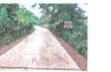
ดำเนินการแล้วเสร็จ