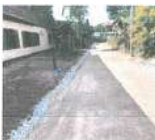
ดำเนินการแล้วเสร็จ