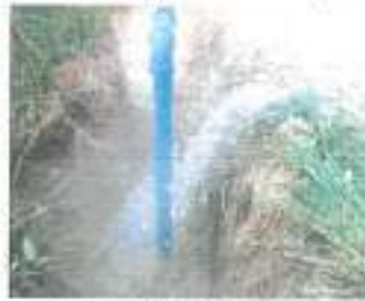
ระหว่างดำเนินการ