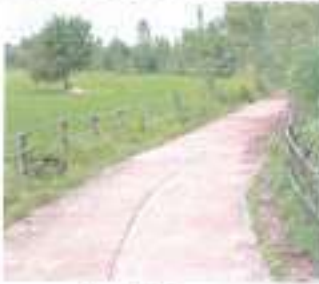
ก่อนดำเนินการ

๓๗. โครงการก่อสร้างอาคารน้ำใต้ดิน ระบบปิด หมู่ ๓๑ บ้านหนองแวง