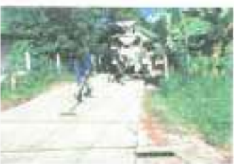
ระหว่างดำเนินการ