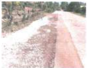
ดำเนินการแล้วเสร็จ

๓๙.โครงการก่อสร้างอาคารน้ำใต้ดิน ระบบปิด หมู่ ๑๒ บ้านหนองใหม่