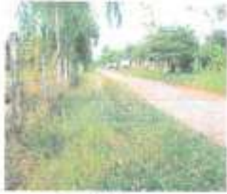
ก่อนดำเนินการ

๓๖. โครงการก่อสร้างอาคารน้ำใต้ดิน ระบบปิด หมู่ที่ ๖ บ้านโคกสุวรรณ