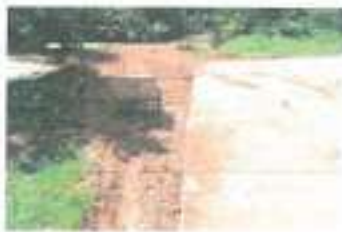
ก่อนดำเนินการ

๒๐.โครงการก่อสร้างถนนคอนกรีตเสริมเหล็กบ้านนาหัวช้าง หมู่ ๔ สายบ้านนาสูงหิน แสนศรี - บ้านนางจุติมา ศรีประภา