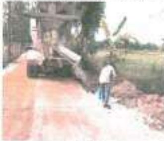
ระหว่างดำเนินการ