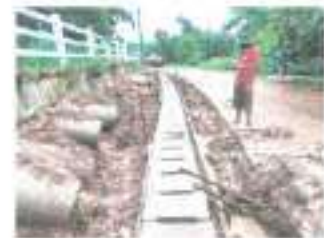
ระหว่างดำเนินการ