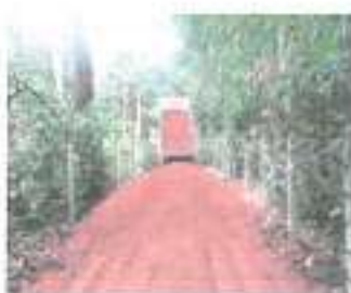
ระหว่างดำเนินการ