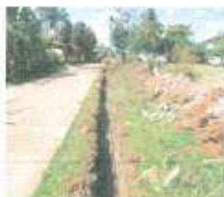
ระหว่างดำเนินการ