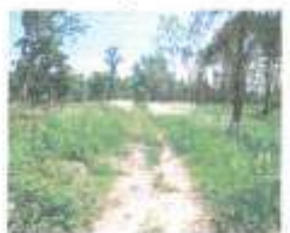
ก่อนดำเนินการ

๒๕. โครงการก่อสร้างถนนลูกรังเพื่อการเกษตรบ้านหนองใหม่ หมู่ ๑๒ สายจากแยกคลองระพีพัฒน์ LMC – ที่บ้านงิ้วคุณ ของนิวัฒน์