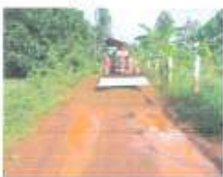
ระหว่างดำเนินการ