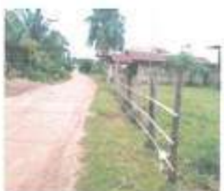
ก่อนดำเนินการ

๒๒. โครงการก่อสร้างรางระบายน้ำรูปตัวยูถนนภายในหมู่บ้านเม็ก หมู่ ๗