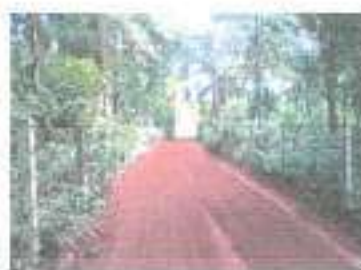
ดำเนินการแล้วเสร็จ

๒๒. โครงการก่อสร้างรางระบายน้ำรูปตัวยูถนนภายในหมู่บ้านเม็ก หมู่ ๗