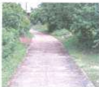
ก่อนดำเนินการ