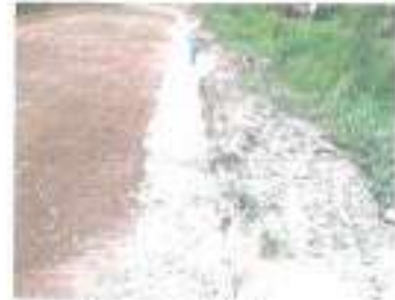
ดำเนินการแล้วเสร็จ

๓๗. โครงการก่อสร้างอาคารน้ำใต้ดิน ระบบปิด หมู่ ๓๑ บ้านหนองแวง