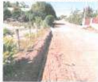
ระหว่างดำเนินการ