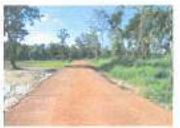
ดำเนินการแล้วเสร็จ