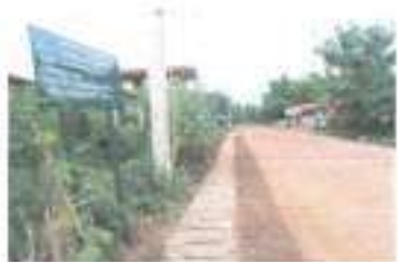
ดำเนินการแล้วเสร็จ

๒๕. โครงการก่อสร้างถนนลูกรังเพื่อการเกษตรบ้านหนองใหม่ หมู่ ๑๒ สายจากแยกคลองระพีพัฒน์ LMC – ที่บ้านงิ้วคุณ ของนิวัฒน์