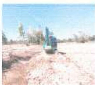
ระหว่างดำเนินการ