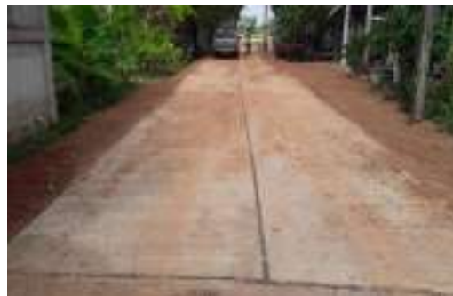
๒๘. ก่อสร้างถนนคอนกรีตเสริมเหล็กสายบ้านหนองอ้อ ต.พรรณา อ.พรรณานิคม-บ้านข้าวขอนแก่น