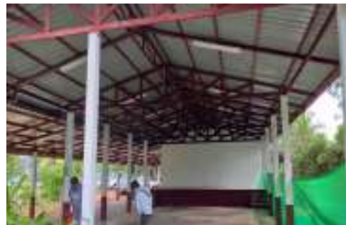
๔๐. ฝึกอบรมเพิ่มประสิทธิภาพและทัศนศึกษาดูงาน