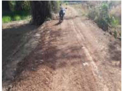
๓๔. ก่อสร้างปรับปรุงถนนเลียบลำน้ำอูน สายบ้านนาหัวช้าง-บ้านปะทอง