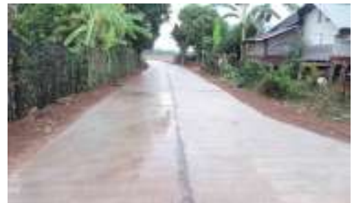
๓๑. ก่อสร้างถนนคอนกรีตเสริมเหล็กบ้านนาหัวช้าง-แยกคลองชลประทาน