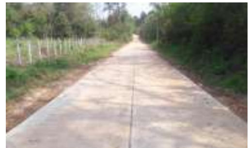
๓๒. ก่อสร้างถนนคอนกรีตเสริมเหล็กบ้านน้อยโนนจักษ์ (สายตรงข้าม รพ.พระอาจารย์ฝั้น อาจาโร)