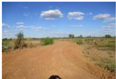
๓๕. ก่อสร้างวางท่อระบายน้ำ คสล.บ้านโคกสุวรรณ หมู่ ๖