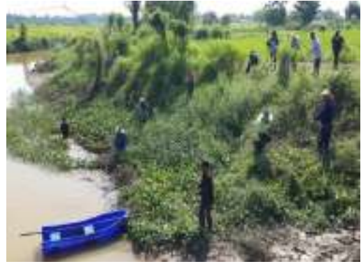
๒๒. อบรมให้ความรู้การอนุรักษ์และการจัดการน้ำเสีย