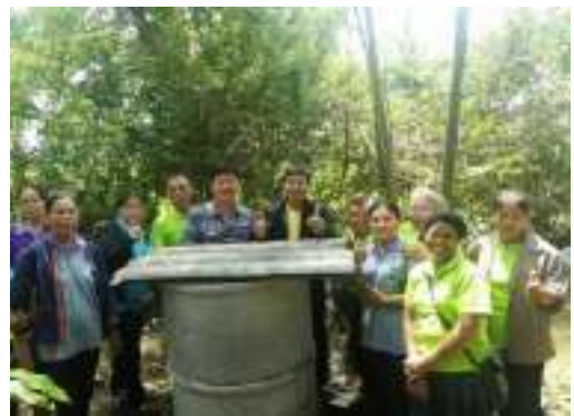
๒๔. ก่อสร้างท่อลอดเหลี่ยมพร้อมติดตั้งประตูระบายทน้ำ บ้านพรณา หมู่ ๒