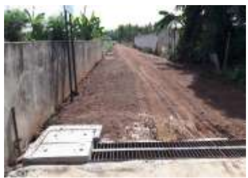
๓๖. ก่อสร้างวางระบายน้ำรูปตัวยู บ้านน้อยโนนจันทน์ หมู่ ๑๐