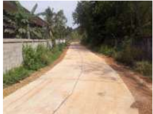
๓๐. ก่อสร้างถนนคอนกรีตเสริมเหล็กสายบ้านบะทองใหม่-แยกคลองชลประทาน