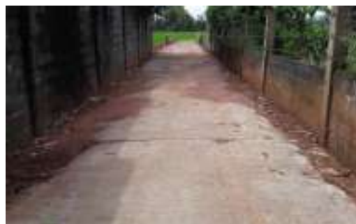
๒๗. ก่อสร้างถนนคอนกรีตเสริมเหล็กบ้านนาหัวช้าง หมู่ ๔