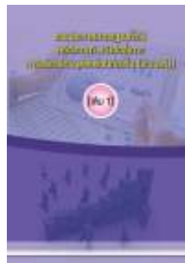
หนังสือ รวมประกาศมาตรฐานทั่วไป หลักเกณฑ์ หนังสือสั่งการ การบริหารงานบุคคลส่วนท้องถิ่น