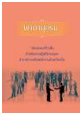
หนังสือ สมรรถนะที่จำเป็นสำหรับการปฏิบัติงานของ ข้าราชการหรือพนักงานส่วนท้องถิ่น