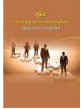
หนังสือ สมรรถนะประจำผู้บริหาร