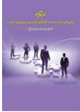
หนังสือ สมรรถนะหลัก