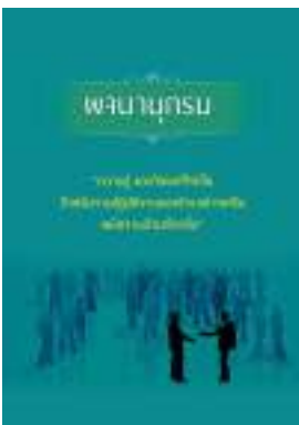
หนังสือ ความรู้ และทักษะที่จำเป็น สำหรับการปฏิบัติ งานของข้าราชการหรือพนักงานส่วนท้องถิ่น