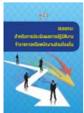
หนังสือ สมรรถนะสำหรับการประเมินผลการปฏิบัติงาน ข้าราชการหรือพนักงานส่วนท้องถิ่น