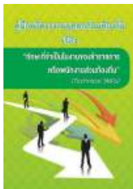
หนังสือ ทักษะที่จำเป็นในงานของข้าราชการ หรือพนักงานส่วนท้องถิ่น