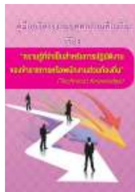
หนังสือ ความรู้ที่จำเป็นสำหรับการปฏิบัติงาน ของข้าราชการหรือพนักงานส่วนท้องถิ่น