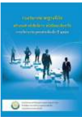
หนังสือ หลักเกณฑ์ หนังสือสั่งการ หนังสือตอบข้อหารือ การบริหารงานบุคคลส่วนท้องถิ่น ปี ๒๕๕๗