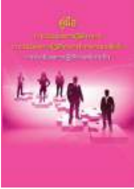
หนังสือ การประเมินผลการปฏิบัติงานพนักงานจ้าง