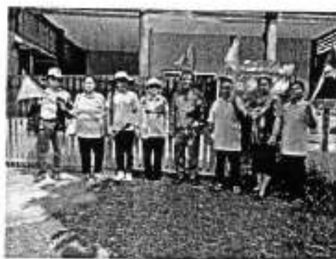
๓๙. โครงการขุดลอกลำรางสาธารณะบ้านหนองแวง หมู่ที่ ๓๑