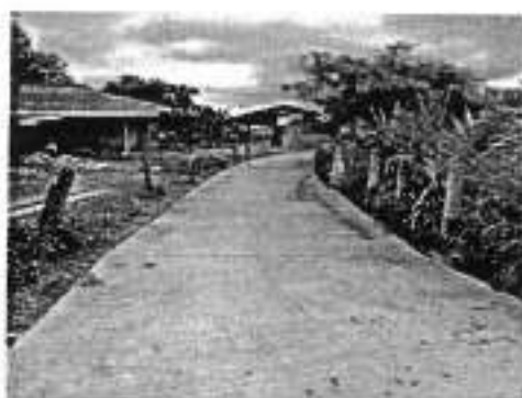
๒๕.โครงการก่อสร้างถนนลูกรังเพื่อการเกษตร บ้านวังปลาป้อม หมู่ที่ ๓ (จากสะพาน-หนองหัวควาย)