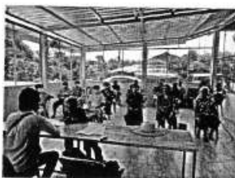
๓๘. โครงการจัดการสิ่งแวดล้อมในชุมชน