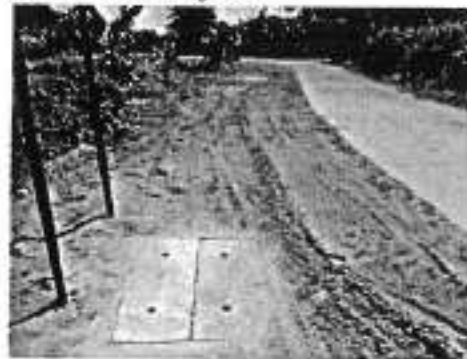
๒๙.โครงการก่อสร้างถนนลูกรังเพื่อการเกษตร บ้านชะทองใหม่ หมู่ ๑๒ (จากที่นาทางอาศัย พระอามาตย์-ที่นา นายบันเทิง ไซบุตร)