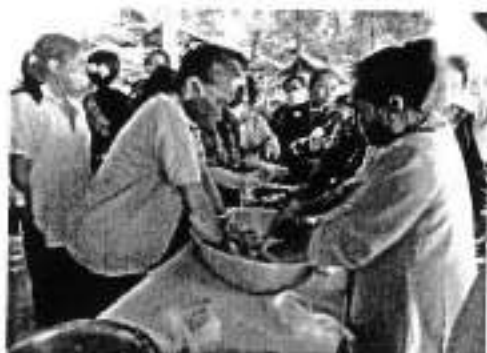
๑๔.โครงการสัตว์ปลอดโรค คนปลอดภัยจากโรคพิษสุนัขบ้า