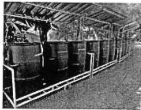
๒๑. โครงการฝึกแยกขยะและจัดการขยะต้นทาง