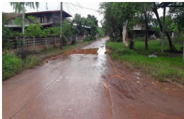
ก่อสร้างรางระบายน้ำรูปตัวยู บ้านโคกสุวรรณ หมู่ ๖ ก่อนดำเนินการ ระหว่างดำเนินการ