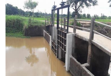
ดำเนินการแล้วเสร็จ