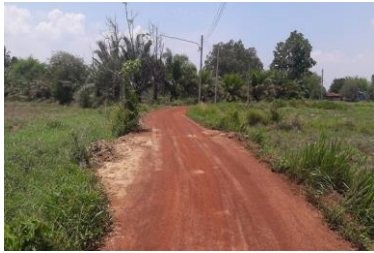
โครงการก่อสร้างถนนคอนกรีตเสริมเหล็กบ้านพรธนา หมู่ ๒ สายข้างเทศบาล ก่อนดำเนินการ ระหว่างดำเนินการ