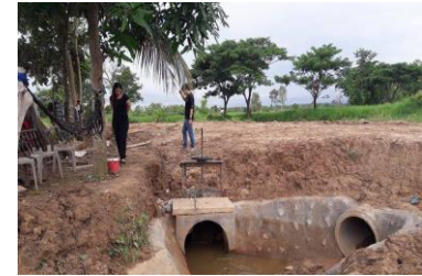
ดำเนินการแล้วเสร็จ