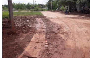
ดำเนินการแล้วเสร็จ