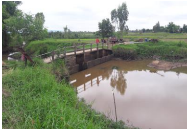
โครงการติดตั้งประตูประบายน้ำฝายลำน้ำออน ก่อนดำเนินการ ระหว่างดำเนินการ