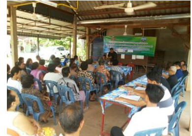
โครงการป้องกันและแก้ไขปัญหายาเสพติด (บำบัดฟื้นฟูและฝึกอบรมอาชีพภายหลังการบำบัดฟื้นฟู)